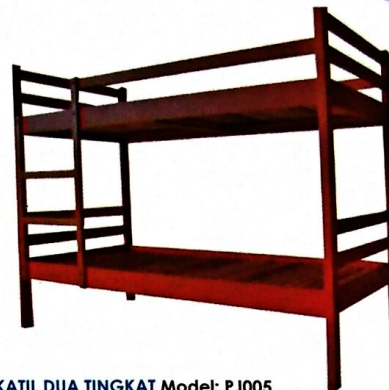
5 KATIL DUA TINGKAT Model: PJ005 Diperbuat dari kayu jenis keras. Kemasiapan berwarna maple SIZE: 1990W X 1005 D X 1580 H [MM]