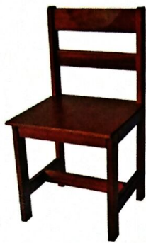
1 KERUSI MURID (D4-6) Model: PJ001 Struktur menggunakan kayu jenis keras dan kemasiapan berwarna maple SIZE: 380 W X 370 D X 410 H X 770 H [MM]