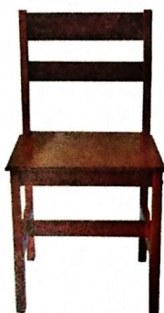
2 KERUSI MURID (T1-6) Model: PJ002 Struktur menggunakan kayu jenis keras dan kemasiapan berwarna maple SIZE: 380 W X 410 D X 460 H X 860 H [MM]