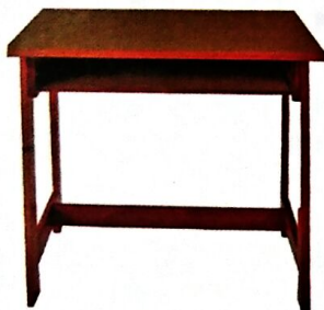
3 MEJA MURID [D4-6] Model: PJ003 Struktur menggunakan kayu jenis keras dan kemasiapan berwarna maple SIZE: 700 W X 500 D X 686 H [MM]