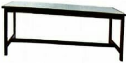
9 MEJA MAKAN Model: PJ009 Struktur menggunakan kayu jenis keras dan kemasiapan berwarna maple SIZE: 1829 W X 914 D X 743 H [MM]