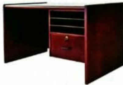
14 MEJA JURUTAIP Model: PJ014 Plywood 4mm binaan berlubang. Dibina dalam pasang siap. Permukaan menggunakan laminate maica MASA. Kemasiapan berwarna mahogany. SIZE: 1229 W X 762 D X 762 H [MM]