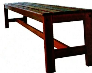
6 BANGKU MAKAN Model: PJ006 Diperbuat daripada kayu keras dan dalam bentuk pasang siap. Kemasiapan berwarna maple SIZE: 1829 W X 375 D X 457 H [MM]