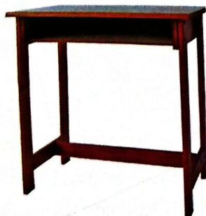
4 MEJA MURID [T1-6] Model: PJ004 Struktur menggunakan kayu jenis keras dan kemasiapan berwarna maple SIZE: 700 W X 500 D X 737H [MM]