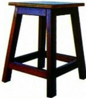
12 KERUSI MAKMAL 400 Model: PJ018 Menggunakan kayu jenis keras dan kemasiapan berwarna maple SIZE: 292 W X 292 D X 400 H [MM]