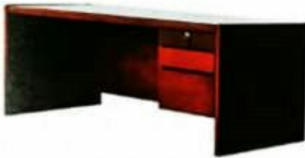
10 MEJA GURUBESAR [MEJA TULIS] Model: PJ010 Struktur menggunakan kayu jenis keras dan kemasiapan berwarna maple SIZE: 1829 W X 912 D X 762 H [MM]