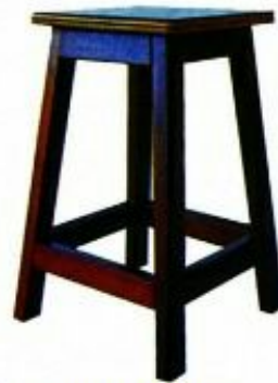
15 KERUSI MAKMAL 600 Model: PJ019 menggunakan kayu jenis keras dan kemasiapan berwarna maple SIZE: 292 W X 292 D X 600 H [MM]