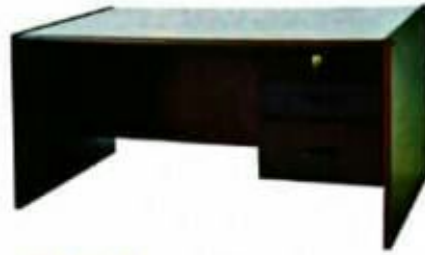
13 MEJA KERANI Model: PJ013 Plywood 4mm binaan berlubang Dibuat dalam bentuk pasang siap. Kemasiapan berwarna maple. SIZE: 1524W X 762 D X 762 H [MM]