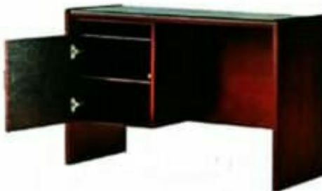
11 MEJA GURUBESAR [SAMPINGAN] Model: PJ011 Struktur menggunakan kayu jenis keras dan kemasiapan berwarna mahogany. SIZE: 1067 W X 457 D X 730 H [MM]