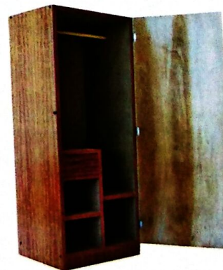
8 ALMARI MURID Model: PJ008 Plywood binaan berlubang dan dibuat dalam bentuk pasang siap. Kemasiapan berwarna maple SIZE: 610 W X 510 D X 1524 H [MM]