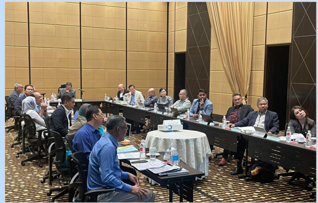
11 November 2023 - Mesyuarat Lembaga Pengarah Universiti UNIMAS Bil. 5/2023 yang ke-110 di Hotel Grand Millenium Hotel Kuala Lumpur.