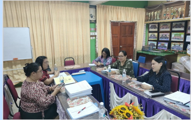
21 November 2023 - Lawatan Naziran Pemantauan Pengurusan Aset dan Stor Kerajaan Di SMK Paku, Bau.