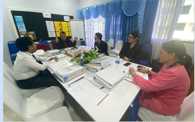
20 November 2023 - Lawatan Naziran Pemantauan Pengurusan Aset dan Stor Kerajaan di Pejabat Pendidikan Daerah Bau.