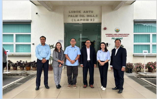
1 November 2023 - Tuan PKP telah menghadiri Mesyuarat Jawatankuasa Lembaga Audit SALCRA yang ke-30 di Lubok Antu.