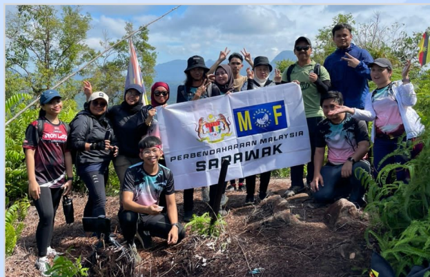
4 November 2023 - Ekspidisi Mendaki Gunung Orad, Bau (G5), anjuran Biro Sukan dan Rekreasi, Kelab PMSarawak.