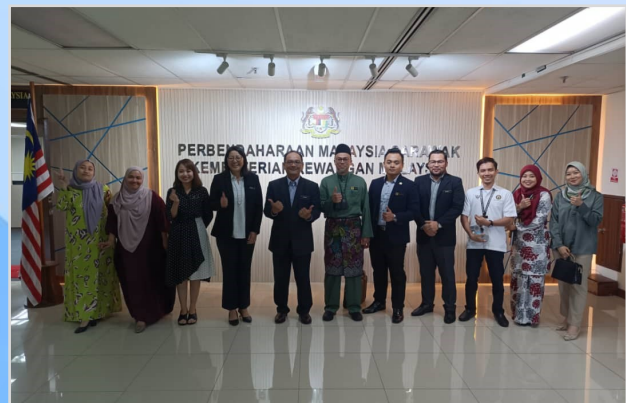
3 November 2023 - Kunjungan Hormat Pengarah Bahagian Pengedaran Gas Sarawak, Kementerian Utiliti dan Telekomunikasi Sarawak kepada Pegawai Kewangan Persekutuan, Sarawak.