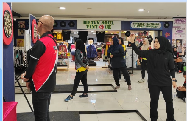
11 November 2023 - Pertandingan Dart anjuran Majlis Kebajikan dan Sukan Anggota-anggota Kerajaan Malaysia (MAKSAK).