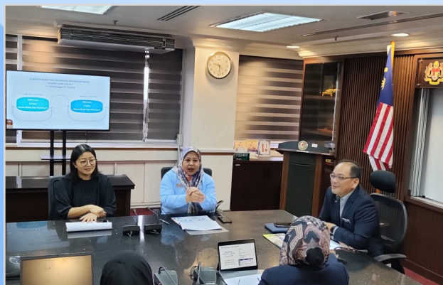
9 November 2023 - Sesi Libat Urus Perolehan Kerajaan di antara Bahagian Perolehan Kerajaan Kementerian Kewangan Malaysia, PMSabah dan PMSarawak.