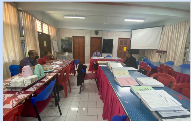
20 November 2023 - Lawatan Naziran Pemantauan Pengurusan Aset dan Stor Kerajaan di SMK Bau.