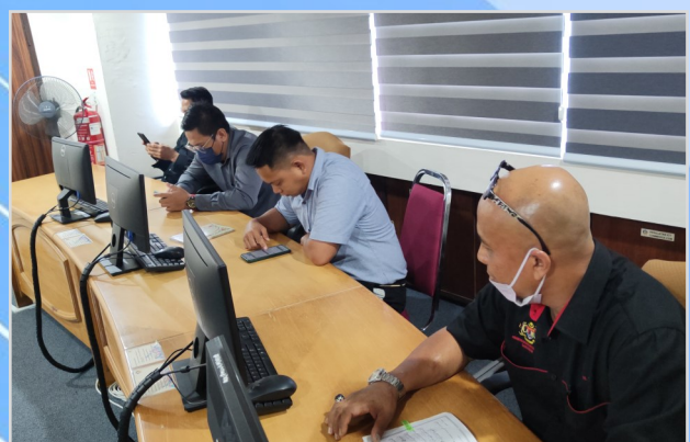
3 November 2023 - Majlis Bacaan Yassin anjuran Biro Kerohanian Kelab PMSarawak.