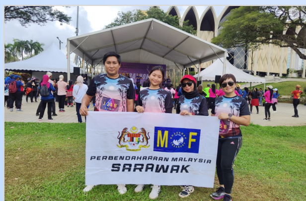
5 November 2023 - Pertandingan Aerobathon HDC Cergas 2023 Sempena Program Integrasi Kecergasan Segulai Sejalai di Padang Merdeka, Kuching.