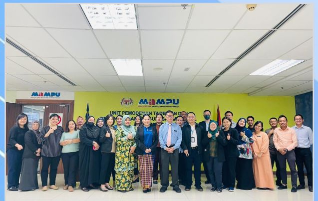
24 November 2023 - Taklimat Tatacara Pengurusan Aset Alih Kerajaan di Unit Pemodenan Tadbiran dan Perancangan Pengurusan Malaysia (MAMPU) Sarawak.