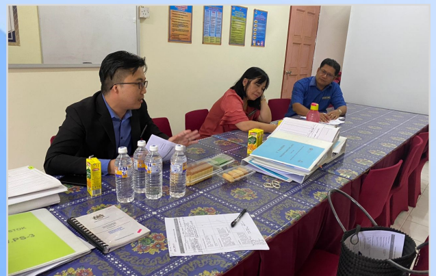
21 November 2023 - Lawatan Naziran Pemantauan Pengurusan Aset dan Stor Kerajaan di SMK Lake, Bau.