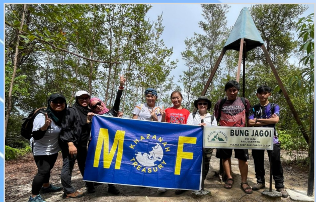
19 November 2023 - Ekspidisi Mendaki Bung Jagoi, Bau (G6), anjuran Biro Sukan dan Rekreasi, Kelab PMSarawak.